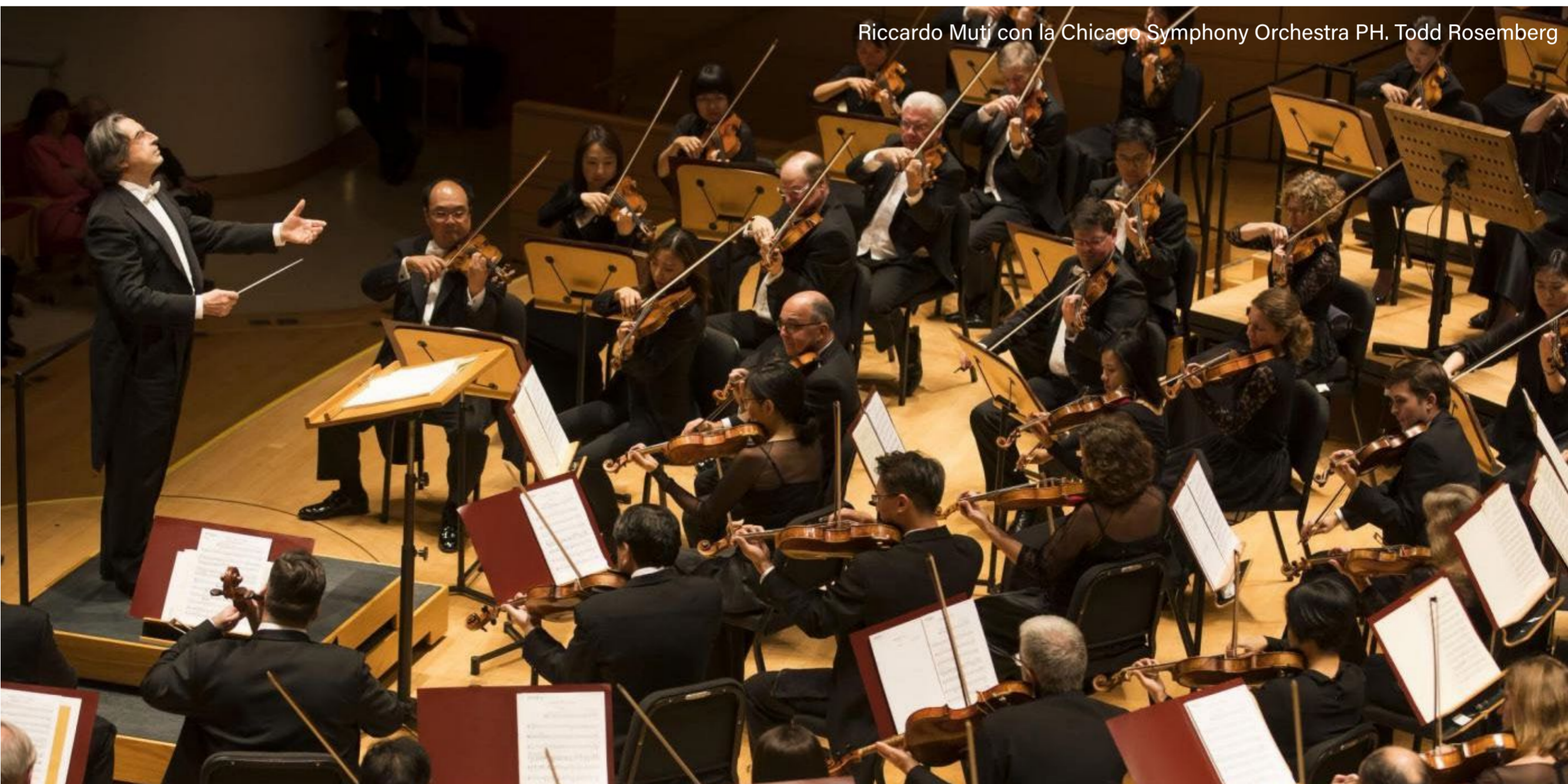
Riccardo Muti con la Chicago Symphony Orchestra

Gli archi sono anche il gruppo più numeroso dell'orchestra sinfonica: popolano l'area più vicina al Direttore d'orchestra. La loro sezione è composta da cinque gruppi di strumenti: violini primi, violini secondi, viole, violoncelli e contrabbassi. Sono disposti da sinistra a destra seguendo l'ordine dal più acuto al più grave.